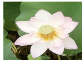
ハチの巣のような花托