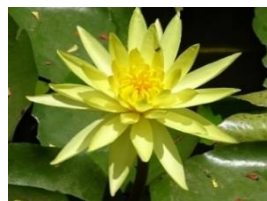
スイレン (他に赤と白もある)