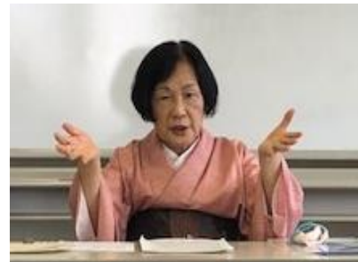
換気に気をつけてソーシャルディスタンスを取って行われました