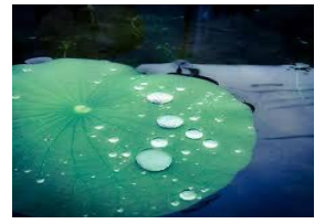
葉に溜まった水玉