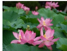
大賀ハス(2000年前の種子から発芽)