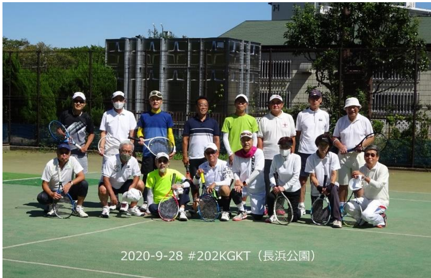
2020-9-28 #202KGKT (長浜公園)