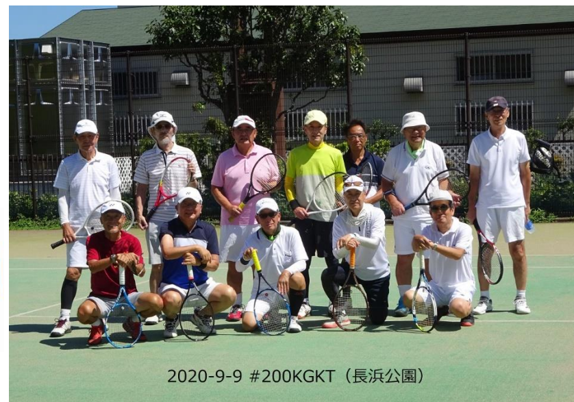
2020-9-9 #200KGKT (長浜公園)