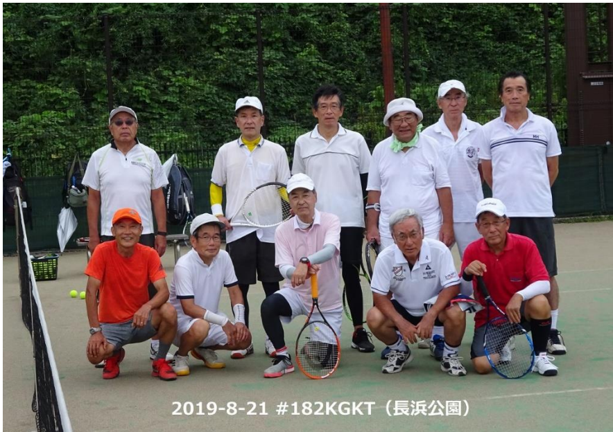
2019-8-21 #182KGKT (長浜公園)