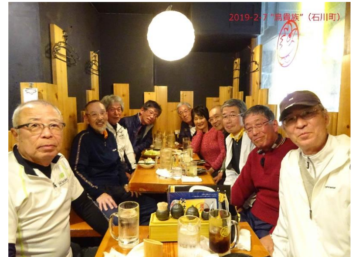
2019-2-7 “鳥貴族” (石川町)