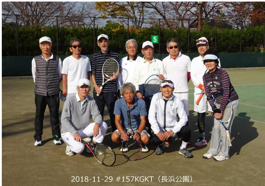
2018-11-29 #157KGKT (長浜公園)