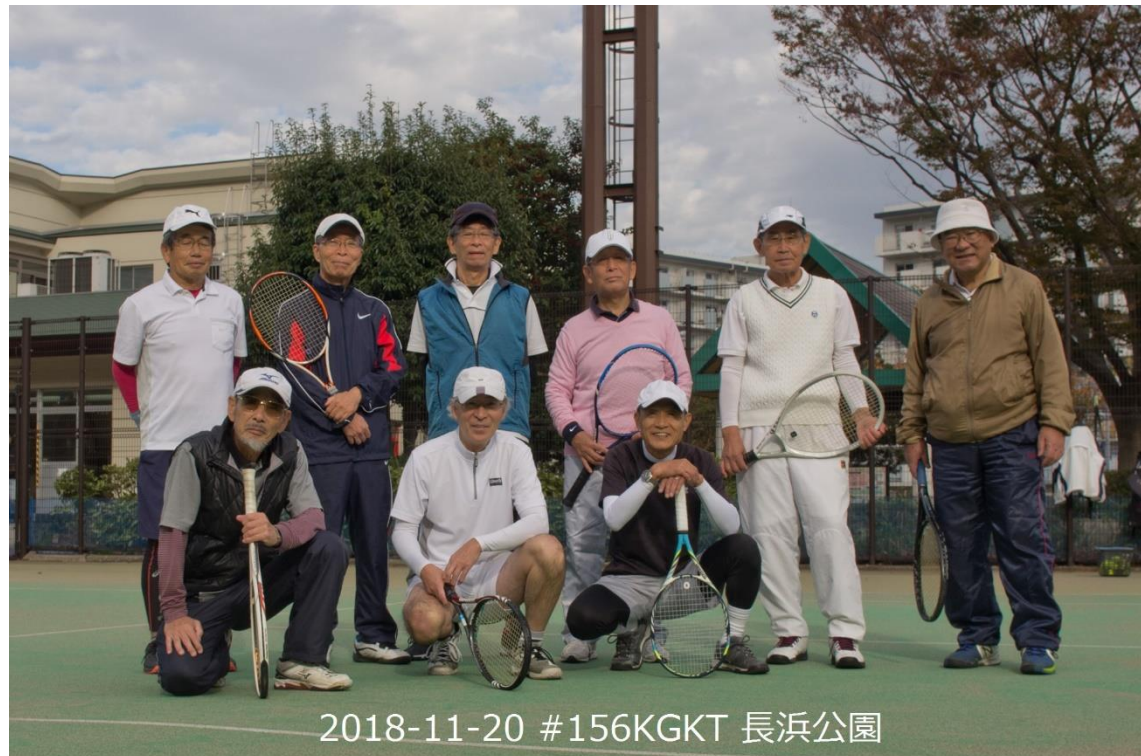
2018-11-20 #156KGKT 長浜公園