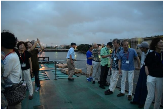
屋形船 デッキ1 (薄暮)