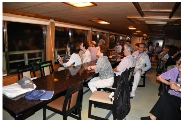
屋形船 船内風景 (4)