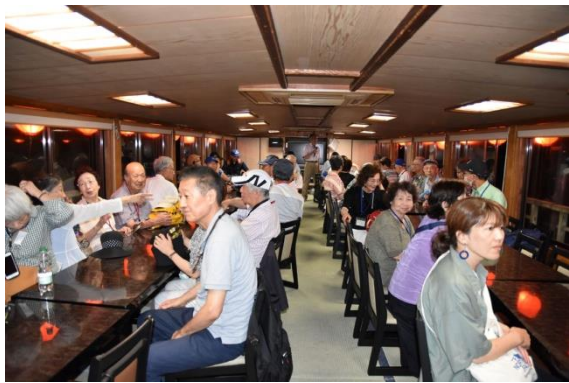
屋形船 船内風景 (3)