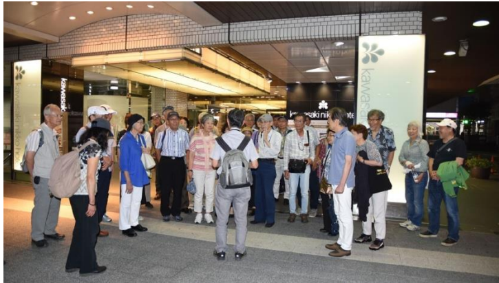
終了挨拶（川崎日航ホテル前）

クルーズを終えて 送迎バスで 川崎日航ホテル前に戻り 次回9月例会と今後の開催予定の説明があり 散会となりました。