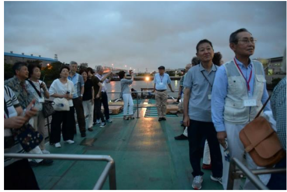
屋形船 デッキ2 (薄暮)