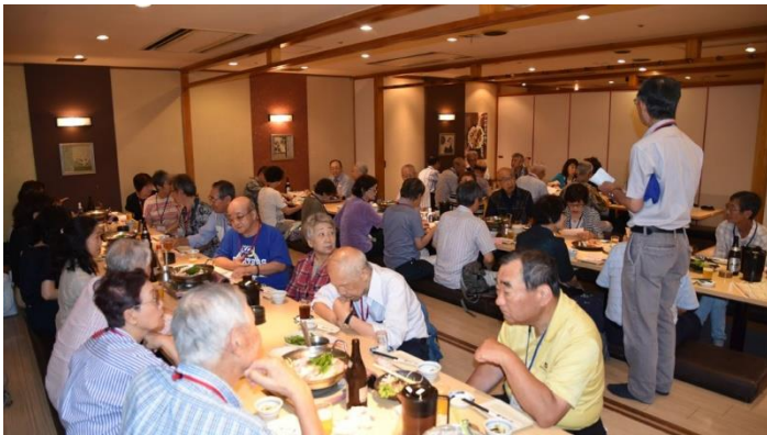
食事会 開会挨拶（魚や一丁）