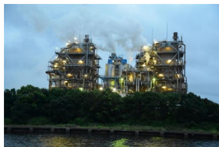
プラント(生産設備) 夕景