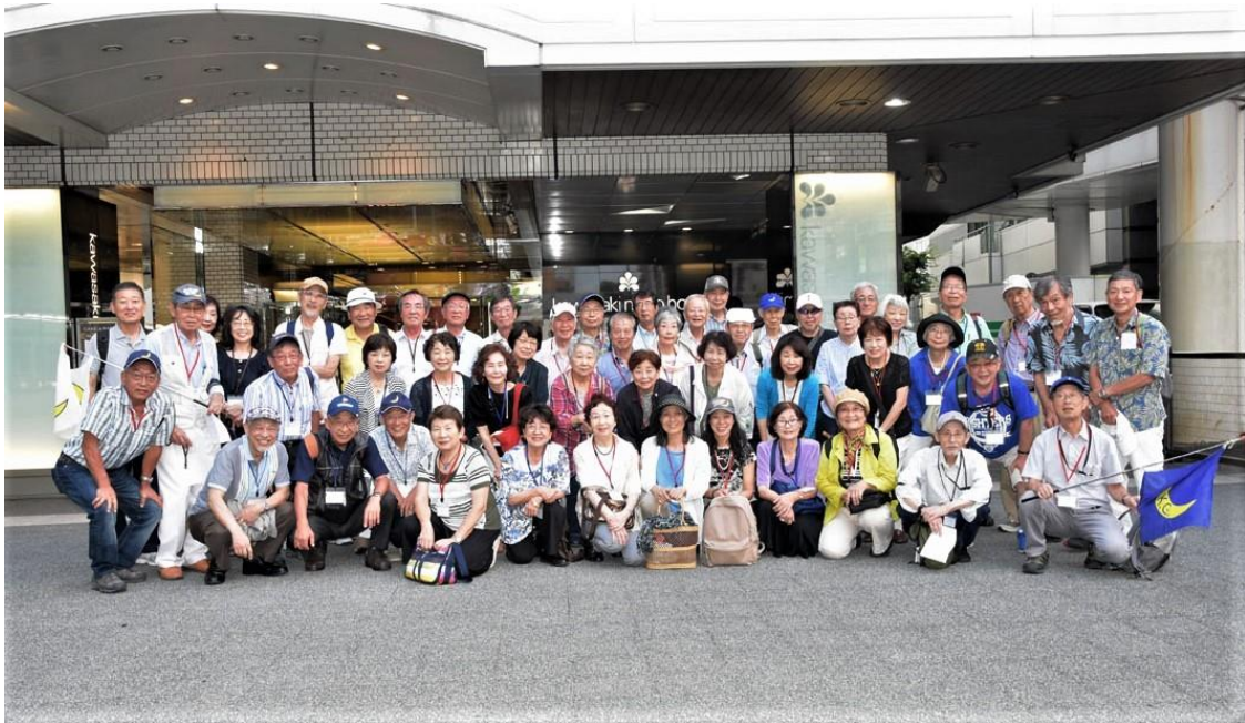
集合写真（川崎日航ホテル前）

食事会終了に合わせて 工場夜景クルーズから参加されるメンバーと「川崎日航ホテル」前で合流、参加者全員の集合写真を撮りました。その後 食事会のみ参加者とは別れて、クルーズ参加者44名は乗船場まで2台の送迎バスに分乗して 屋形船発着所へと移動しました。