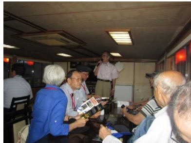
屋形船 案内ガイド