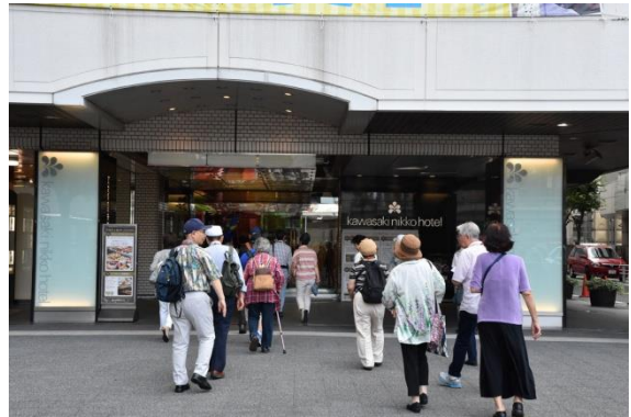
川崎日航ホテル到着