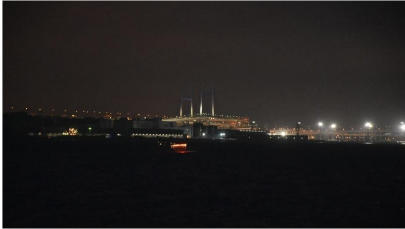
ベイブリッジの夜景