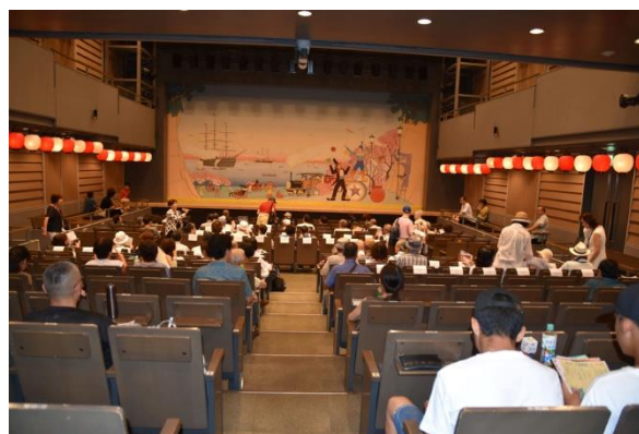
観客席入場 (芸能ホール)