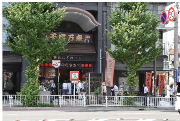
横浜にぎわい座 (正面入口)