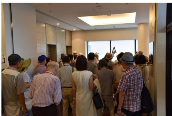
開催挨拶 (にぎわい座)