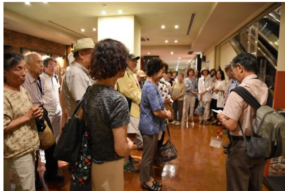
終了挨拶 (クロスゲート 4F)

今回は 真夏の屋外散策を避け 横浜にぎわい座の寄席観覧と舞台裏見学、「みなとヨコハマ」の夕景を眺めながらの軽夕食会を楽しみました。この夏、ひとあじ違った思い出として アルバムのひとこまに加わることを企画した世話役一同からも願っています。