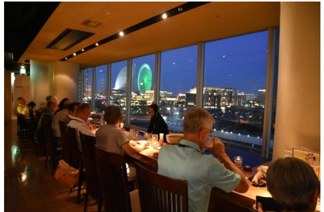
みなとみらい 夕景