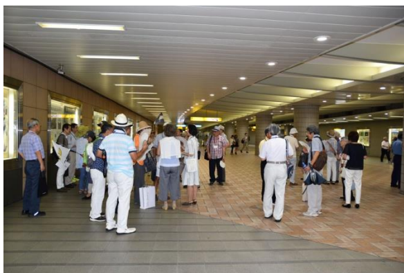
集合風景 (桜木町地下道)

改札口前の混雑を避け 野毛方面への連絡地下道にて受付を行った後 一行は寄席会場「横浜にぎわい座」に向かいました。入口ホールにて世話役から入場券と公演パンフレットが配布され、そのまま 総合案内・情報コーナーの 2F に上がりました。同エレベーターホールにて 行事開催の挨拶を行い、特別参加者 5 名の紹介とともに当日のスケジュールを含む説明がありました。その後 3F の芸能ホールに移動・入場し、楽しむ会用に確保された場所に着席して 開演を待ちました。