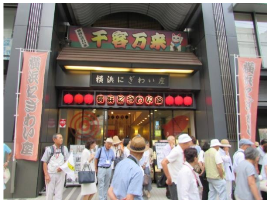
横浜にぎわい座を後に

その後 横浜にぎわい座を後にして 集合場所の駅南口改札前を経て みなとみらい側に移動、桜木町クロスゲート4Fにある「千の庭 HANARE」に到着しました。食事会場では カウンター席を含むテーブル毎、7グループに分かれ、セット料理と飲物による歓談の時間をもちました。各グループでは みなとみらいの夕景を眺めながら 暑さも忘れ 弾む会話とともに 楽しい一時を過ごしました。閉会にあたり 世話役から 次回9月例会と今後の開催予定 及び 支部事務局から 支部行事予定の紹介がありました。