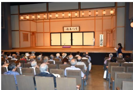
高座（にぎわい座の舞台）