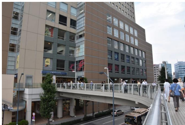
食事会場へ（駅前デッキ）