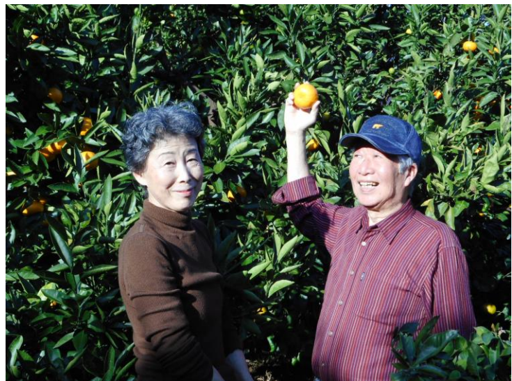
「楽しむ会——湯河原のみかん狩り」2016年11月