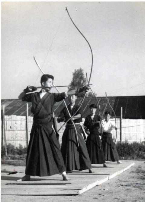
弓道場完成前は野天で練習(1956年)

末筆に坂村真民の言葉「二度とない人生だから、後から来る者のために種を用意しておくのだ」を付け加えさせていただきます。