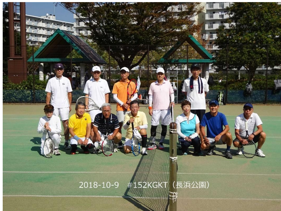
2018-10-9 #152KGKT (長浜公園)