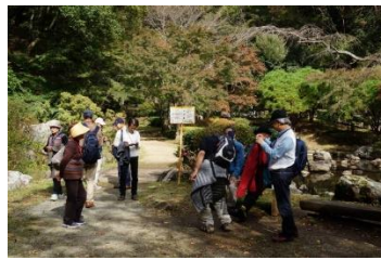
せせらぎ広場 (小休止)