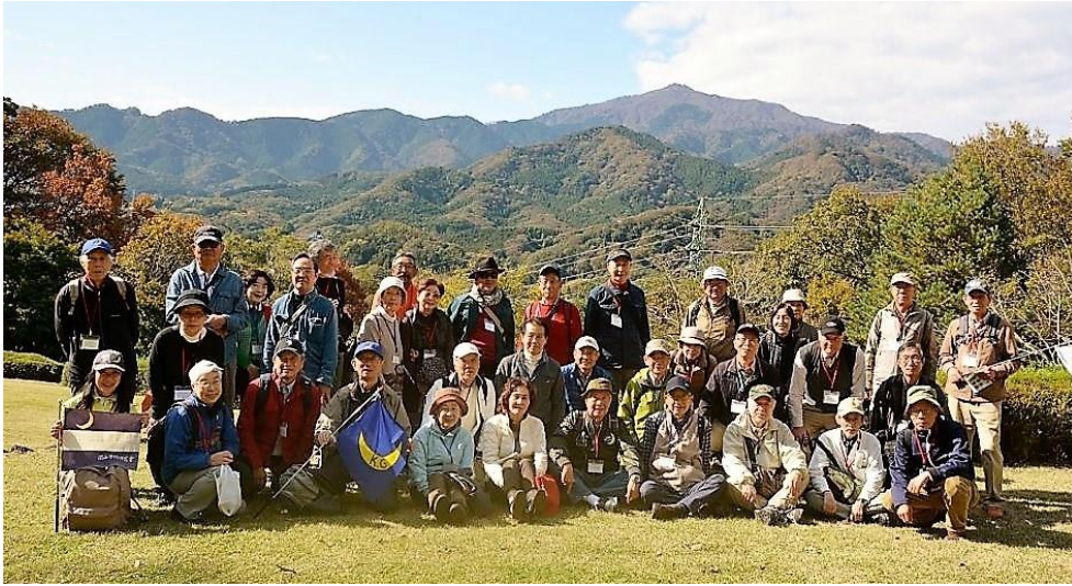
集合写真(おおやま広場)

おおやま広場から散策道を下り 公園のシンボルでもある 森のかけはしを渡って 公園西側、中央口近くの公園管理事務所に着きました。 事務所隣接の森の民話館や“せせらぎ広場”内の寸草亭などを各自散策、観覧後、せせらぎ広場前にて 少し色づいたもみじを背景に写真撮影をしました。