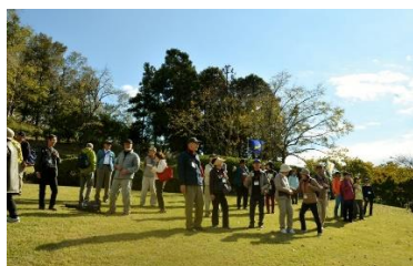
おおやま広場（到着）

入口から続く緩やかな階段・遊歩道をゆっくりと上りアスレチック広場を抜けてバーベキュー場へと歩を進めました。小休止の後、まもなくおおやま広場に到着しました。広場では丹沢・大山を目の前に眺望を十分楽しんだ後、その大山を背景に集合写真を撮りました。