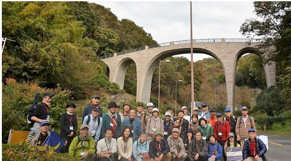
集合写真（森のかけはし）

公園を後にして 中央口付近からも森のかけはしを背にまた一枚、写真に収め、七沢温泉入口から県道沿いに 昼食処 カフェレストラン「ベンガル」に向かいました。