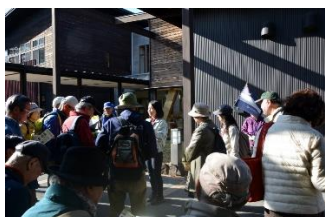
自然環境保全センター（説明）

食後、県立自然環境保全センターを訪れ、係員からセンターについて 概要説明を受けた後、展示室内の各資料等を見学して 県内における自然との関わり方を学びました。