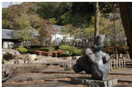
であいの広場 モニュメント

当日は好天に恵まれ 秋らしい爽やかな陽気の下、紅葉も徐々に見頃を迎えつつある七沢森林公園と自然環境保全センターを訪ね 丹沢東山麓の豊かな自然に浸ることが出来ました。