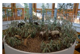
展示物（同センター展示室内）