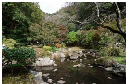
せせらぎ広場の池