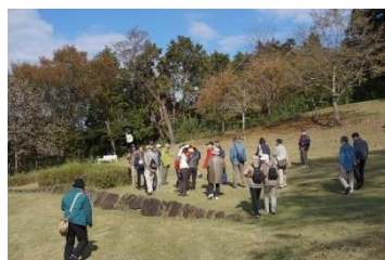
おおやま広場（小休止）