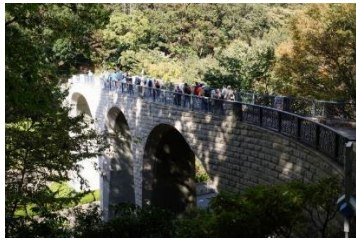
森のかけはし(橋を渡る)

おおやま広場から散策道を下り 公園のシンボルでもある 森のかけはしを渡って 公園西側、中央口近くの公園管理事務所に着きました。 事務所隣接の森の民話館や“せせらぎ広場”内の寸草亭などを各自散策、観覧後、せせらぎ広場前にて 少し色づいたもみじを背景に写真撮影をしました。