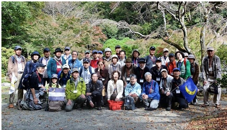
集合写真 (せせらぎ広場)