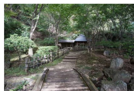
寸草亭 (せせらぎ広場)