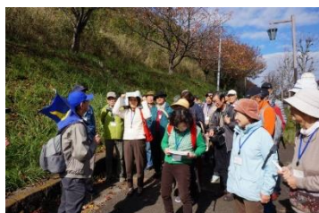
朝の挨拶（森の里口）

一行は厚木バスセンターから路線バスで厚木市の西部丘陵地帯にあって里山の風景を残した都市公園の一つ、県立七沢森林公園に向かいました。公園東側入口にあたる森の里小学校前で下車、その場で朝の挨拶と当日の行程説明があり森の里口から公園の散策をスタートしました。