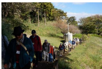
森の里口から公園内へ