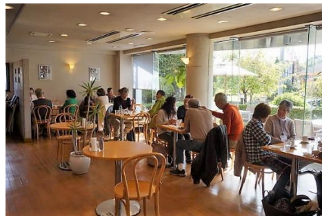
食事風景（カフェレストラン「ベンガル」）

食後、県立自然環境保全センターを訪れ、係員からセンターについて 概要説明を受けた後、展示室内の各資料等を見学して 県内における自然との関わり方を学びました。