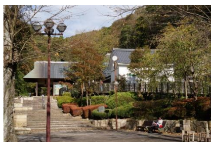
管理事務所入口 (公園中央口)