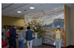
尊徳記念館 ホール