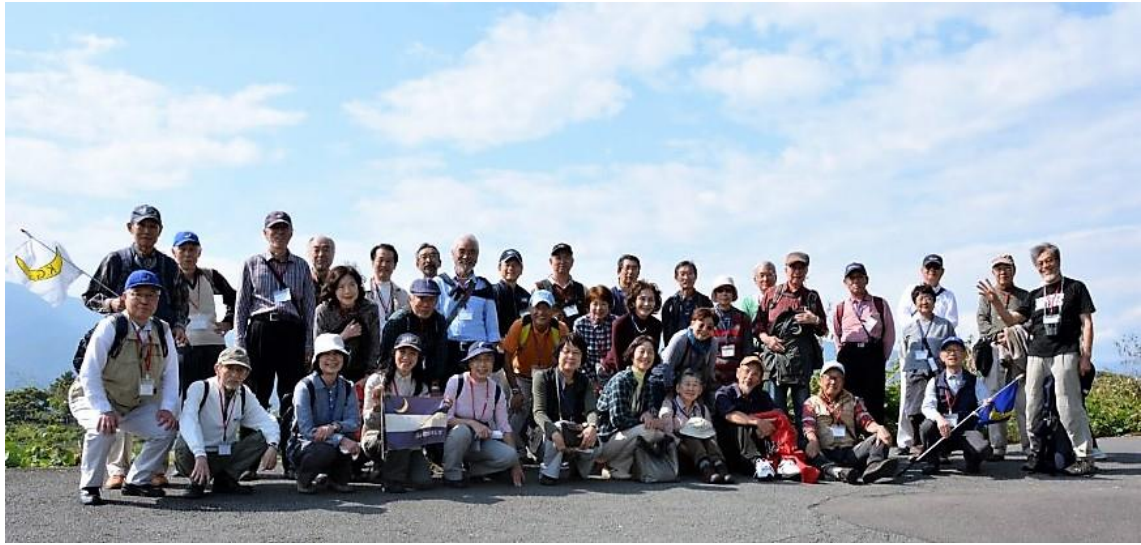
集合写真（酒匂川・報徳橋東詰付近）

昼食会場の下大井「海鮮飯処 ふじ丸」ではいつもの例会と同様 今回も楽しく懇親の時間を過ごしました。