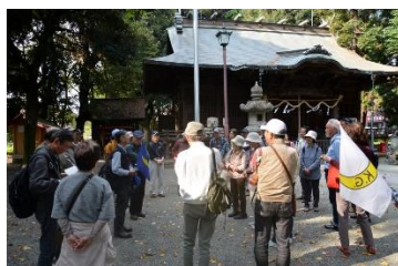
終了挨拶(三嶋神社)