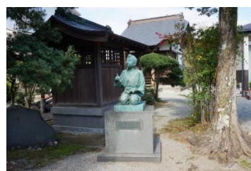
尊徳座像 (善栄寺境内)