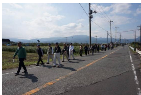
昼食会場(下大井)へ向かう一行