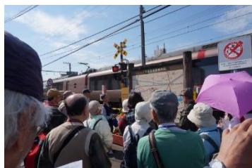
朝の挨拶 & 行程説明（富水駅前）

第148回 二宮尊徳生誕地 酒匂川流域を訪ねて「尊徳記念館から上大井へ」は10月18日（木）37名が参加して開催されました。当日はまずまずの好天に恵まれ 参加者は小田急富水駅前 定刻の午前9時50分までに集合、尊徳遺跡案内版の前で朝の挨拶と地図を見ながら 当日の行程について説明が行われ 駅前をスタートしました。