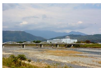
西丹沢連峰を望む