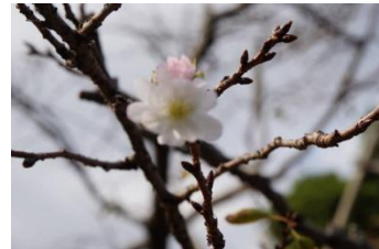
十月桜(?) (保安寺境内)