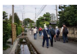
栢山神社に向かう