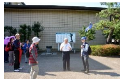
記念館 前庭にて説明